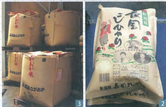
1 金属検出機で出荷前の米を検査する様子 2 貯蔵される玄米 3 長岡産米の精米商品