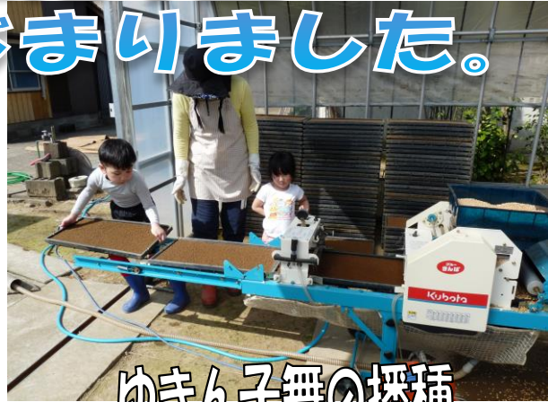
ゆきん子舞の播種