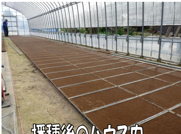
播種後のハウス内